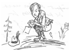
Nr. 67 Alfred Kubin

Axel Klöse - Ultraleicht Katalog Druckerei Spezialisierte Druckerei für Kataloge auf Ultraleichtpapier Geringes Gewicht - Optimiertes Format - Günstiges Porto - Lettershop-Servive - Auflagen ab ca. 500 Stück.