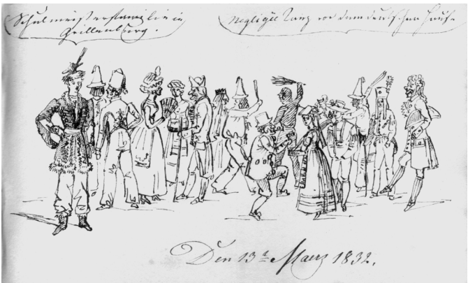
Nr. 9 "Denkmäler meiner Freunde"